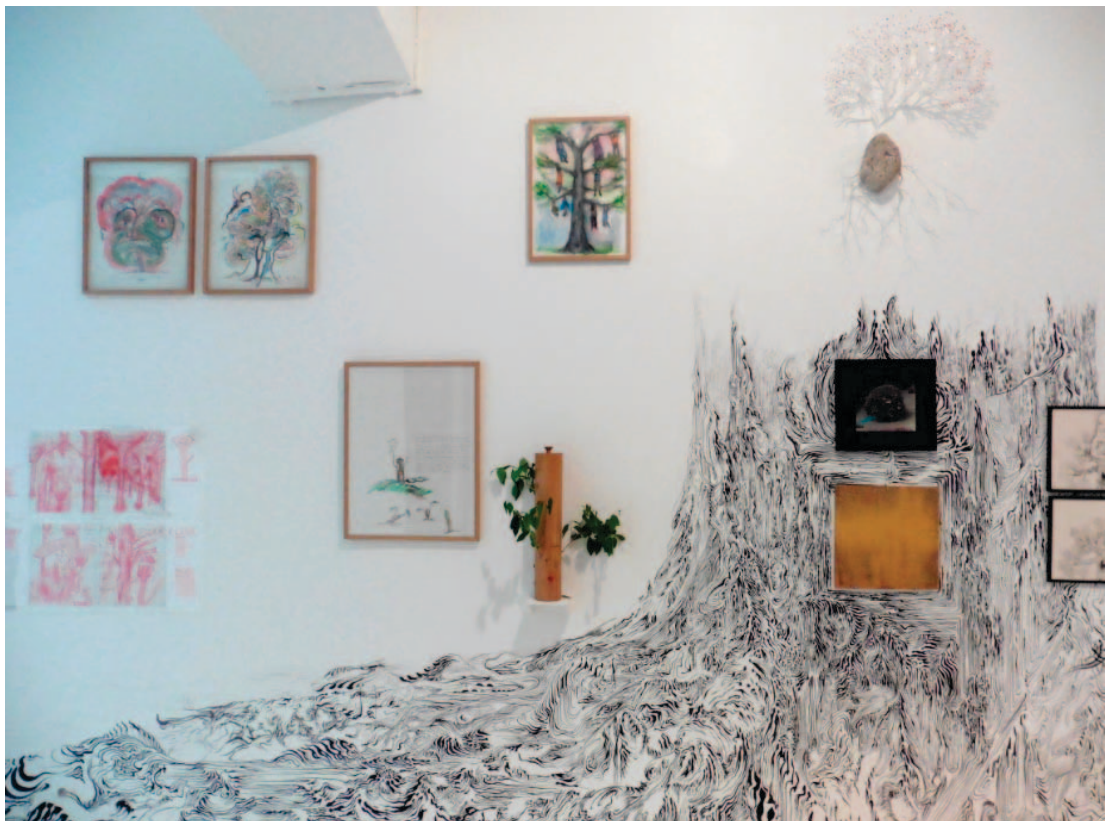
Galerie du Jour agnès b Un autre monde, Du 2 juin au 16 juillet